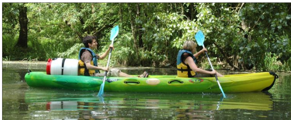
Un décor de rêve dans le silence de la rivière.

Avec le retour du soleil et du beau temps, les Pagaies des Bords de Saône proposent leurs parcours EcoPagaieur à Saint-Jean-de-Losne.